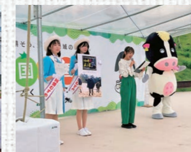
純情むすめがステージで国消国産をPRしました