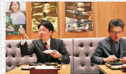
限定メニューを味わうJA江刺関係者

JA江刺は岩手県内陸南部の奥州市江刺地域で構成され、「江刺金札米」「江刺牛」「江刺りんご」「江刺野菜」の4つのブランドがあります。地域ごとの土地条件を生かし、この4本柱の農畜産物を組み合わせた複合型農業が江刺農業の特徴です。フェア期間中には、トマト、ピーマン、きゅうりの「江刺野菜」や、「江刺牛」、「江刺りんご」、「江刺ひつじ肉」のほか、江刺産のひとめぼれが新米で提供されました。