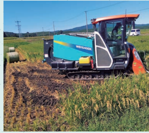
写真1: 専用収穫機で収穫と同時にロール

に比べて籾の割合が小さいため、WCSの調製(発酵)に必要な糖含有率が高く、高収量も期待できます。雑草が多く、水不足の影響もあって、収量は5.5ロールでした。収穫時期は黄熟期を過ぎていましたが、酪農家の品質評価は良好で、本品種の収穫適期中の広さを実感できました。C法人での実証は、昨年限りですが、今年度はA法人でも「つきはやか」の栽培を始めています。 今後、A、B両法人のWCSについて、収量や発酵品質、牛の嗜好性について確認します。特にも「つきはやか」の特性を活かした高品質なWCS生産体系を検討し、水稲農家・酪農家の経営安定を図られるよう支援して行きます。