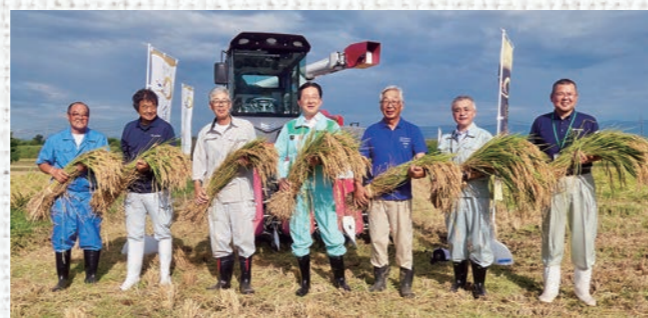
達増知事(中央)と生産者で記念撮影