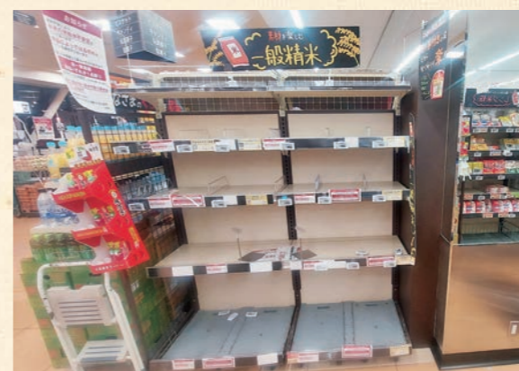
令和6年8月関東スーパーの米売り場

だいています。私たちは生産者がいなければお米を販売することができず、消費者に届けることもできません。生産者のみなさまが米作りを続けていけるよう、実需者との結び付きを意識して、より一層販売に注力してまいります。