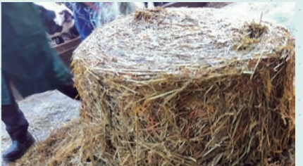
写真2-1: 開封直後のWCS(八幡平市)