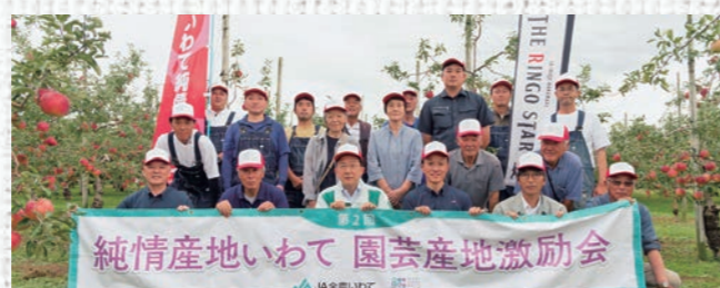
達増知事(左から3番目)と生産者で記念撮影