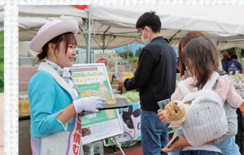
りんごジュースの試飲会の様子