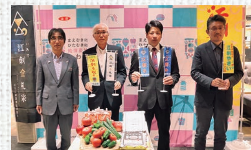
関係者で記念撮影