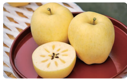
いわて純情"プレミアム"冬恋