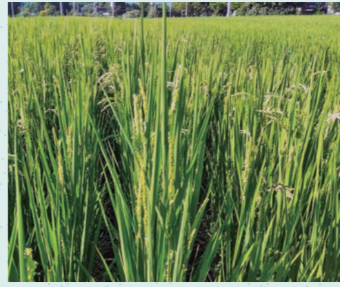
写真3: WCS専用品種「つきはやか」 籾の着生が疎らで茎葉の割合大

に比べて籾の割合が小さいため、WCSの調製(発酵)に必要な糖含有率が高く、高収量も期待できます。雑草が多く、水不足の影響もあって、収量は5.5ロールでした。収穫時期は黄熟期を過ぎていましたが、酪農家の品質評価は良好で、本品種の収穫適期中の広さを実感できました。C法人での実証は、昨年限りですが、今年度はA法人でも「つきはやか」の栽培を始めています。 今後、A、B両法人のWCSについて、収量や発酵品質、牛の嗜好性について確認します。特にも「つきはやか」の特性を活かした高品質なWCS生産体系を検討し、水稲農家・酪農家の経営安定を図られるよう支援して行きます。