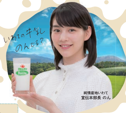
純情産地いわて 宣伝本部長のん