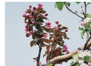
図5 授粉専用品種の高接ぎ

を行って和合性、不和合性の判断をしてみました。しかし、現在は遺伝子解析の技術が進んだことから、品種別にS遺伝子型を調べることによって交雑和合性を確認することが可能となりました(表1)。 先に述べた自家不和合性はS遺伝子により制御されており、S1S2などと表されるS遺伝子型で、数字が同じ品種同士では受精できず、どちらの数字も異なれば受精して結実します。また、片方のS遺伝子が同じであれば不完全和合と呼ばれ、受精はしますが効率は落ちます。