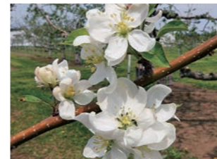
図2 ドルゴ (S x S x )