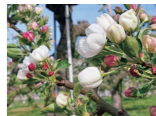
図1 スノードリフト (S 25 S x )