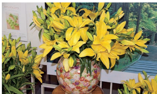
JA新いわて(南部)のすかしゆりを展示

県産花きの需要喚起を図るため、5月上旬から盛岡市の岩手県産業会館4階エレベーター前や関連団体事務所内で県産花きの展示を始めました。他にもJA新いわてや雫石町役場のロビー等でも展示しています。また、5月22日・29日には「花き農家応援キャンペーン~フラワーバイキング~」を開催しました。