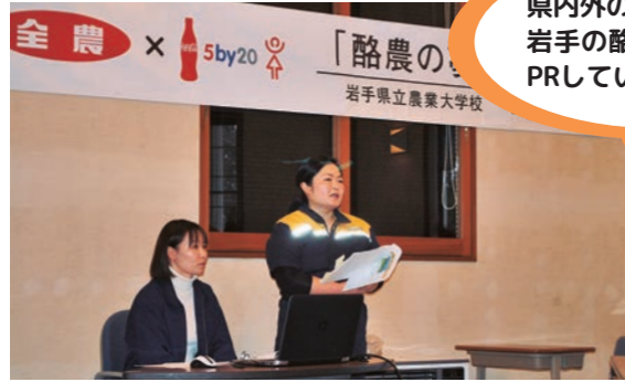
岩手県立農業大学校での出張授業

今年度より「岩手県酪農ヘルパー人材確保定着化推進事業」を実施します。全農岩手県本部では、酪農ヘルパーホームページの開設、グッズ等を製作して岩手県の酪農ヘルパーをPRしていきます。各利用組合でも本事業を活用し、要員確保、定着化、広域活動に向けて、一緒に取り組んでいきましょう！