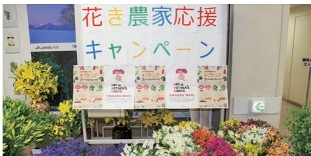
花き農家応援キャンペーン