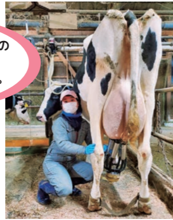
学生インターンシップ