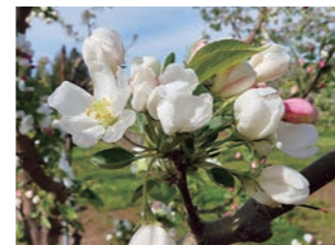
図4 レッドバット (S 25 S x )