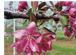
図3 プロフュージョン (S x S x )