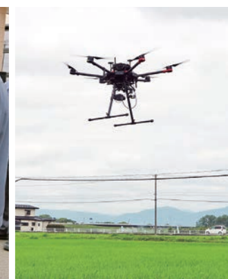
ほ場でドローンを飛ばしました