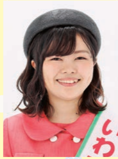
2019いわて純情むすめ