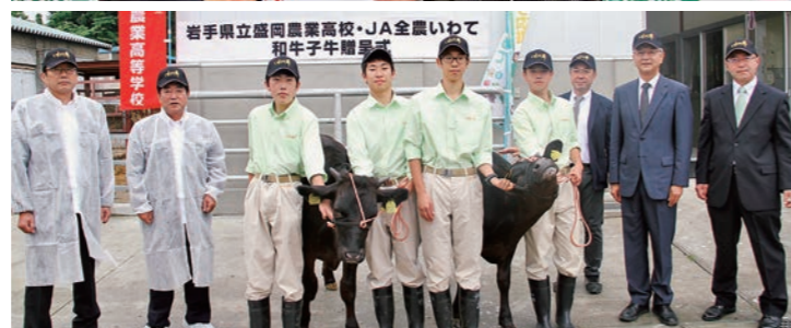
贈呈した子牛2頭と、関係者ら