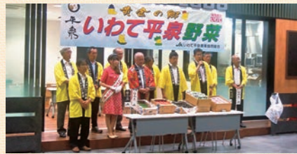
7/4開催「JAいわて平泉トップセールス」