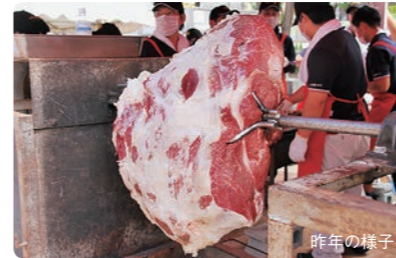
見どころは、その場で丸焼きするいわて牛の骨付きモモ肉

今年配布するいわて牛は1500食を予定。その他にもキュウリや牛乳など県産農畜産物のお振る舞いも。無くなり次第終了ですので、ぜひお早めにお越しください!