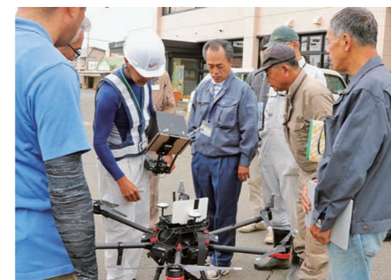
ドローンの説明を受ける見学者

ドローンを活用した「ほ場の健康診断」に、農事組合法人となんの見学者は興味津々の様子でした。