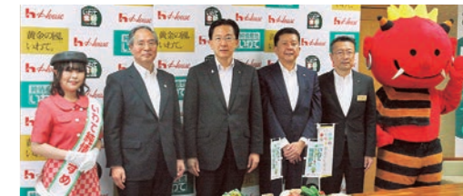
表敬訪問での記念撮影

発表されたレシピは、ハウス食品のホームページやテレビCM、県内スーパーの店頭で紹介されます。岩手の野菜がたっぷり入った、暑い夏にぴったりの「いわて純情野菜のカラフルカレー」を、ぜひご賞味ください。