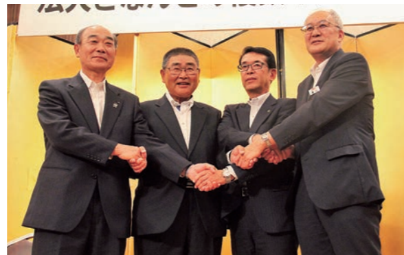
連携強化を誓い合いました

今後もJA全農いわてでは、3か年の複数年契約を基本として、取り組みを強化していきます。