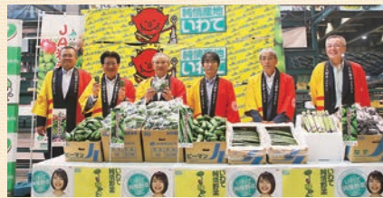
7/6開催「JA岩手ふるさとトップセールス」