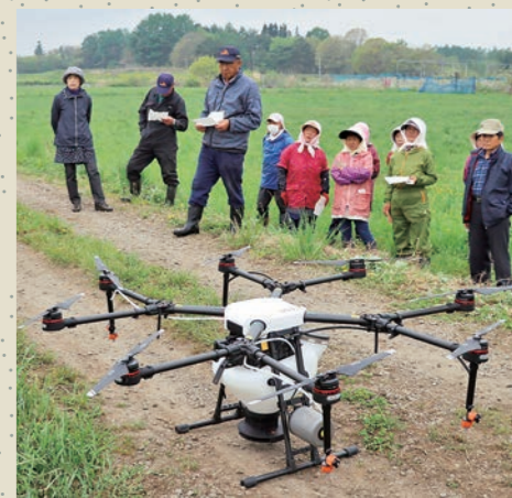
(農)サンロードの皆さん

(農)サンロードは新たな飼料用米専用種「たわわっこ」の安定生産を経営課題としており、これまで移植栽培だけであったものを本会からのドローン散播による省力化の実践メニュー提案を受けて水稲直播栽培の省力効果を確認することとしています。