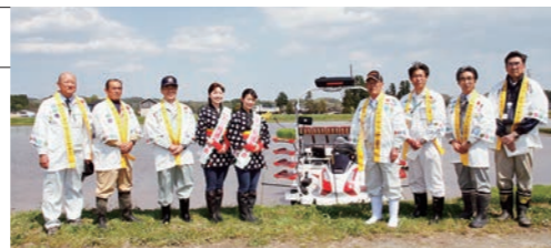
セレモニー参加者の集合写真(北上市稲瀬町の圃場にて)

今年度の「銀河のしずく」の生産計画については、県内全体で作付けが約1400ha、収穫量は約7600トンと予定しています。