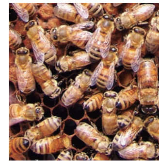
図1 セイヨウミツバチ