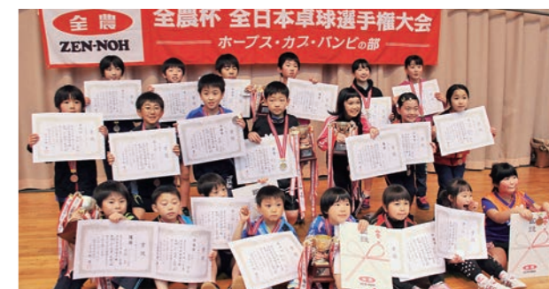
上位入賞を飾った選手達

全国大会は7月に神戸総合運動公園体育館(グリーンアリーナ神戸)にて開催されます。