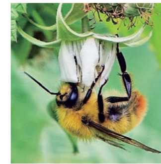
図6 コマルハナバチ(♂)

◇ 受粉のしくみ 果樹の安定生産には確実な受粉と結実が欠かせません。樹種によって様々な受粉の形態がありますが(表1)、リンゴをはじめとする多くの果樹は、同一品種どうしでは受粉ができない「他家受粉」タイプと呼ばれています。これらの樹種は昆虫や風によつて違う品種の花粉を運んでもらう必要があります。この働きを「虫媒」「風媒」と称しています。 自家受粉のブドウ(栽培品種)は開花時に花粉が自動的に柱頭に付着するので、訪花昆虫も風も必要としません。