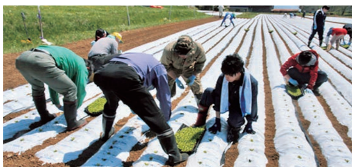
レタスの定植体験の様子