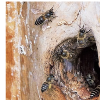
図3 ニホンミツバチ