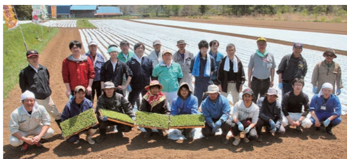
集合写真(一戸町奥中山のレタス圃場にて)

定植したレタスは来月下旬に収穫され、海外技能実習生がイオン店舗にて販売体験をする予定です。