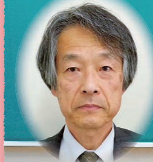
園芸部 生産販売課