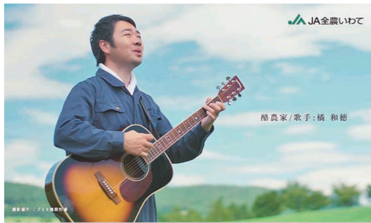
TVCM 「想いを唄に乗せて」篇

生乳生産管理チェックシートの記帳状況を検証します。 全戸の農家を対象に、農協、関係機関の協力を得ながら、年3回程度の検証作業(巡回による記帳状況の確認)を実施し、洗剤、殺菌剤の適正使用、薬剤等の残留防止の徹底を図ります。