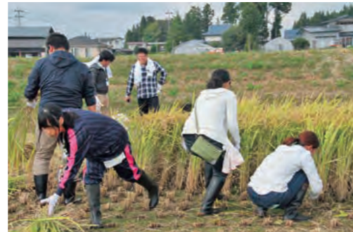
丁寧に、手際良く刈っていきます。