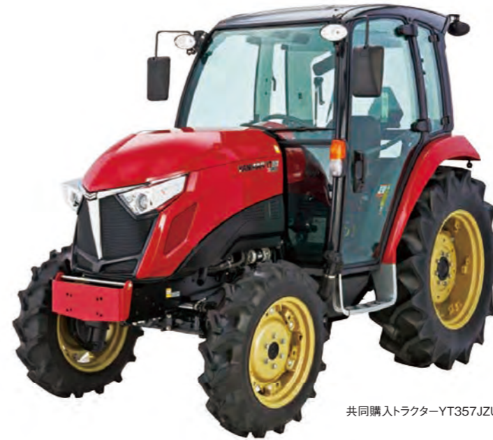
共同購入トラクター-YT357JZUQH

※3…価格引下げ割合はシンプル農機の普及状況や業者との競合度合い等により地区ごとに異なります。