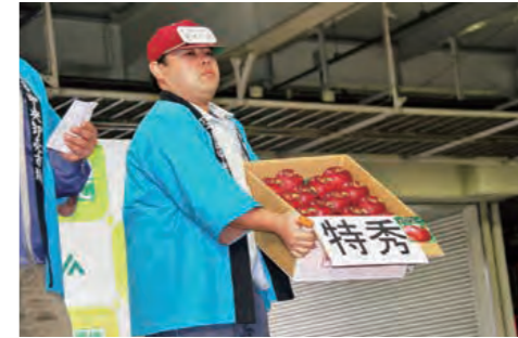
特秀28玉は9万円で落札(盛岡会場)

今後は「ふじ」や「ジョナゴールド」、「王林」、そして「はるか」といった品種のりんごが出荷されます。ぜひ、多彩な味わいのいわて純情りんごをご賞味ください。