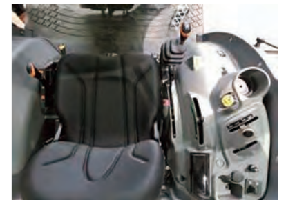
長時間でも疲れにくいデラックスなシート