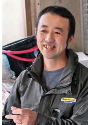
「何事も基本が大事」と熱く語る敏さん