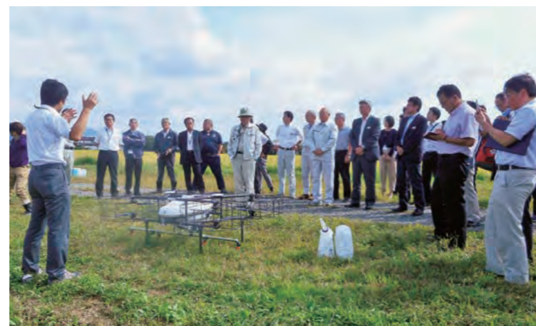
ナイルワークス担当者から説明を聞く参加者

◆自動飛行型ドローン 本年度の「5月号」に続き、本会とJA新いわてJAいわて中央とそのモデル経営体(11経営体)のプロジェクトが取り組むトータル生産コスト削減に向けた実証メニューから、労働力確保対策として高い関心がある「ドローン」の最新情報を紹介します。 本会は、自動飛行型ドローンを開発製造する(株)ナイルワークス(本社・東京都)に出資し、来年度からの発売に向けて実証実演を進めています。9月13日には、矢巾町の水田で農薬散布を想定した実演会を開き、本会東北各県の営農担当者や近隣のJA・県担当者など約30人が見学しました。 自動飛行型ドローンの特徴は、予め圃場に