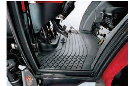
広いフルフラットデッキ