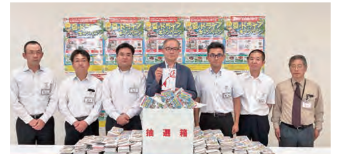
たくさんのご応募ありがとうございました。