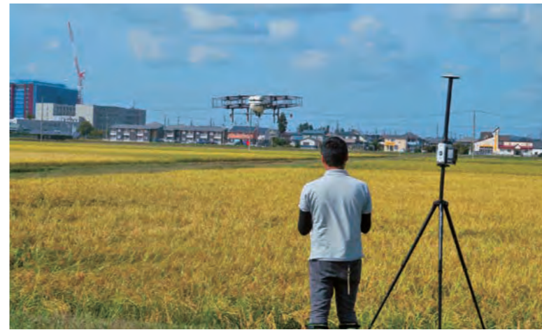
中央:ドローン、中央下:操縦者、右下:基地局