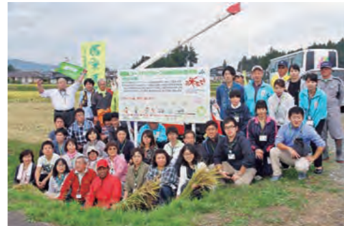
花巻市の飼料用米圃場にて

JAいわて花巻営農部の担当者の指導の下、31名の参加者が手刈り・コンバインでの収穫を体験しました。手刈りのコツを教わった参加者は、次々と稲を刈っていき、あっという間に作業は終了。続くコンバインでの稲刈りは、一人ずつ実際に運転を体験。初めてのコンバインの運転に、参加者は楽しそうに笑顔を見せていました。