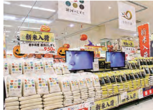
新米がお店にズラリと並びました。