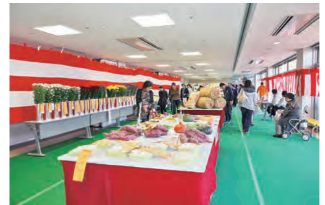
農産物品評会。出品された農産物は購入することもできます。

表彰式の後には、出品者対象の抽選会と来場者対象の農産物クイズを行い、豪華景品を目当てに会場は大いに盛り上がりました。