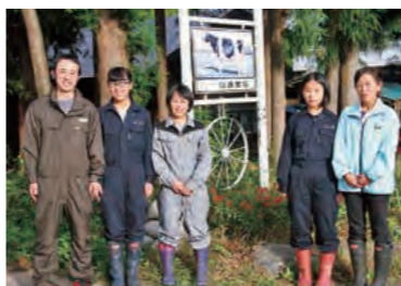
山崎家の皆さん。子供たちも作業のお手伝いをします

10年後は、子供たちの成人・周りの環境の変化など転換期を迎えます。酪農に関しては飼料確保を第一に、地域で助け合って岩泉の酪農を盛り上げていきたいです。家族に関しては子供たちとの触れ合いを大切にしていきたいです。岩手県は酪農経営の酪農家が多く、それぞれが独特な方法で経営しています。その分、ここまで家族経営を維持できるのが課題になります。私のおすすめの実践は目標の「見える化」。特に「乳質事故ゼロ」の目標を掲げて、「いわての牛乳は安全で美味しい」というイメージを皆で広め、岩手県の酪農経営者存続に繋がってほしいです。ぜひ、JA全農いわての皆さんにも「見える化」実践の呼びかけをしていただけたらと思います。